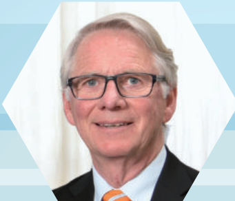
ステファン・レンバート 教授

スウェーデンのイエテボリ大学、歯科研究所カリオロジー科の教授・スウェーデン王国厚生労働省の歯科ガイドライン委員の責任者を務めている。う蝕と歯周病の予防と治療に関する論文はこれまでに100を超える。