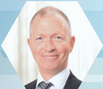
ピーター・リングストロム 教授

10年に1度改定されるスウェーデンナショナルガイドラインの責任者ピーター・リングストロム先生より最新の情報が発信されます。当日はピーター・リングストロム先生他、時代を変えていく講師陣による特別講演が予定されています。