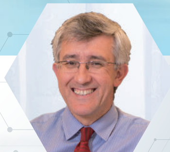
アルドガン・カンタルチ博士