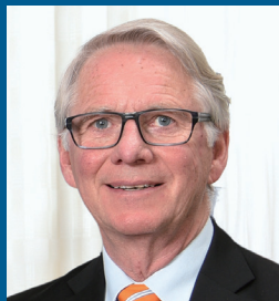
ステファン・レンバート教授

スウェーデンのイエテボリ大学、歯科学研究所カリオロジー科の教授・スウェーデン王国厚生労働省の歯科ガイドライン委員の責任者を務めている。う蝕と歯周病の予防と治療に関する論文はこれまでに100を超える。