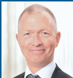
ピーター・リングストロム教授