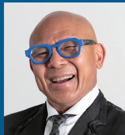
アラン・クオン・ヒン博士

スウェーデン歯周病学会会長、ヨーロッパ歯周病学会 総長を務め、国際的なピア・レビュー・ジャーナルに170以上の論文を発表。レンバート教授の研究は、歯周病、インプラント周囲炎、口臭の治療、高齢者人口の歯周衛生および歯周病、歯周病と一般的疾患の関連性に重点が置かれている。